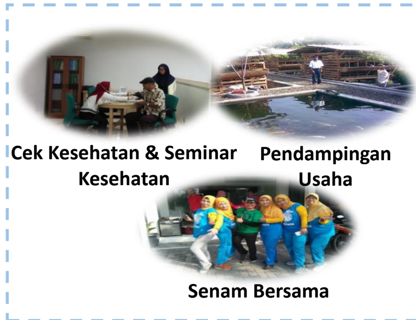
Cek Kesehatan & Seminar Kesehatan

Kegiatan Komunitas “Pensiun Berkah” Mandiri Syariah